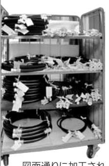
図面通りに加工され納品を待つ。

主に県内の機械メーカーに、部品となるゴム・樹脂製品やホース類を納めています。図面に合わせて加工し納品することが多く、どんな分野の機械かによって求められる素材も違います。加えて、近所の農家の方がホースを買いに来るなど小口にも対応しており、本当に扱っている品目が多い。中には飛び込みで「今作っている機械にこんなモノが欲しい」と相談に来られる方も。一緒に考え、提案することが必ずしも利益につながるわけではありませんが、将来の芽です。問屋として、こういった窓口を大事にさせて頂いています。少しでも地元でお役に立ちたい、お客様にとっての「便利」を大切にしていきたいと、頑なにこのやり方で通してきました。