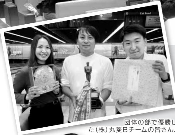
団体の部で優勝した(株)丸菱Bチームの皆さん。