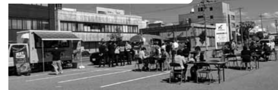
人気のキッチンカーも並ぶ。

猛暑だった今年の夏の疲れを癒して頂きたくかき氷の無償提供も行いました。焼きさんまは1千匹以上を販売し、キッチンカーの各店舗もほとんど完売！天候にも恵まれたお祭り日和で、最高の一日になりました。 今後も青年部会の活動にご期待ください！