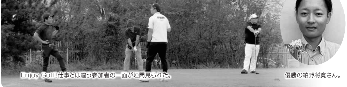
Enjoy Golf!仕事とは違う参加者の一面が垣間見られた。