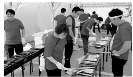
さんまの焼ける匂いが食欲をそそる。

満50歳未満の組合員の経営幹部を中心に構成し、組合の将来イメージを描きつつさまざまな提言を行っています。現在も20名を超える方々が活動しています。ぜひご参加ください。 ●ご興味のある方は事務局までお問い合わせください。