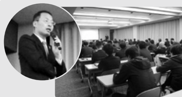
昨年度第4回目の講師は山野金沢市長。フェイスブック等を通して市民と積極的にコミュニケーションする山野市長がIT活用の可能性について語られた。

「うちのキラリンさん」「わが社をPR」に掲載ご希望の方はぜひ事務局までお問い合わせください。取材に伺います