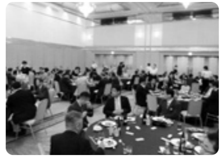
総会に引き続き、懇親会が行われた。

〔第4号議案〕 平成25年度収支予算(案)並びに賦課金の賦課徴収方法承認の件 〔第5号議案〕 平成25年度組合借入金の高限度額及び組合員に対する貸出限度額承認の件 〔第6号議案〕 理事及び監事改選の件 以上の議案すべてについて審議を終了し、午後6時4分閉会した。 その後、懇親会を開催した。