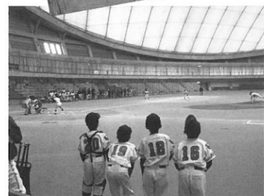
先発選手も控えの選手も一つになって戦いました。