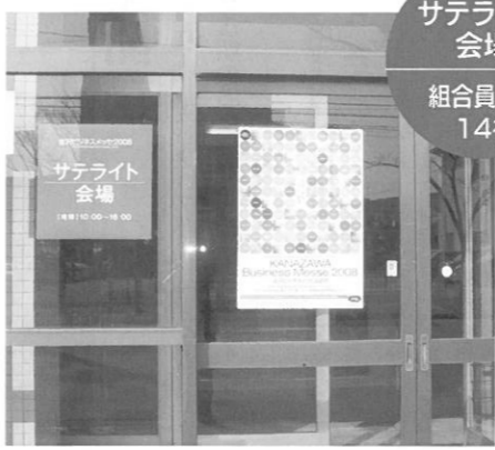
サテライト会場 組合員企業 14社