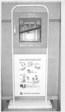
1階ロビーの電話機横に設置されています。

最近、駅や大型ショッピングセンターなどで見かけるようになったAED(自動体外式除細動器)を金沢流通会館の1階に設置しました。