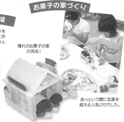
お菓子の家づくり

7月27日、金沢流通会館において「キマツシカナザワなつまつり」が盛大に開催され、約2,000人のみなさんにご来場いただいた。第4回目となる今回のなつまつりは、問屋の強みを活かした「遊びと学びの場」、親子ふれあいの場を提供し、ものづくりの楽しさを実感してもらい、感受性の向上を図ることで、未来を担う子ども達の健全な育成に繋げることを主旨に実施した。