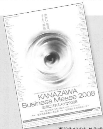
事前告知のため作成されたチラシ(左)とポスター。

開催後、出展した組合員に対してアンケートを行ったところ、商談ありが66件(ブース出展社38件、行政・学校・支援機関28件)、内商談成立が2件(ブース出展社2件)という回答があり、まずまずの成果であった。また、意見としては「団地内の企業を良く知ることができた」、「自社のPRができた」、「普段接触のない業種・業者との交流は大変良い」など、出展社からは良い評価が多かった。