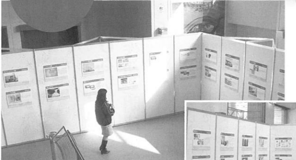
62社が参加し、パネルで自社の業務をPRした。