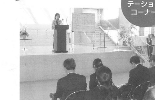
プレゼンテーションコーナー