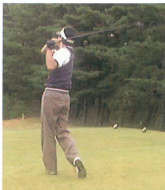
詳細はホームページでご覧下さい。 http://www.kimassi.or.jp