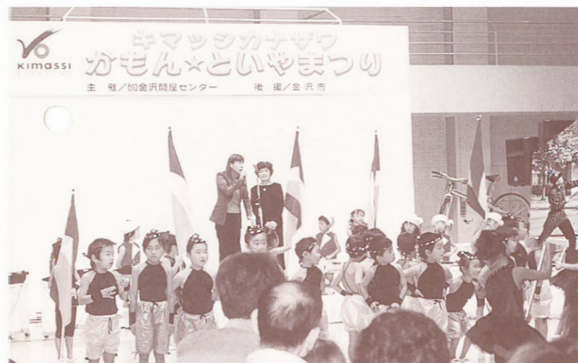
▲弓取保育園マーチングバンド!!