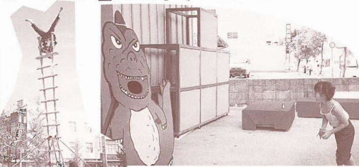
▲結構難しかった怪獣玉入れ。 ▲勇壮な加賀鷲も披露された。