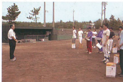
詳細はホームページでご覧下さい。 http://www.kimassi.or.jp