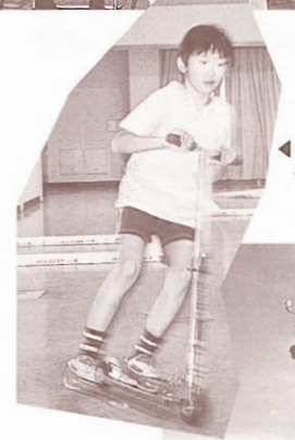
▲キックボードの競技に、子供達も熱くなった。