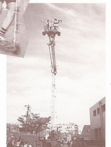
▲消防車に乗車、ビルの5階の高さまで伸びるクレーンに長蛇の列が。

今回のイベントは問屋センターとしては久々の催しであり、近代化研究会としては大変有意義なイベントでした。イベントは目的を達成するための手段の一手法です。我々の目的は大きく分けて2つありました。第1は、問屋センター活性化の何らかのきっかけをつかむことです。組合員企業132社の共通の活性化は、まず、問屋センターのイメージアップと考えました。市民の方々にはイベントへの多数参加をいただき、限られた人、企業だけのセンターというイメージの払拭をして、気軽に利用できる公園が完成するというPRもできました。2,000名近くの参加者があったことは予想以上の成功でしたし、事前のPR次第ではより多くの参加も望めたと思います。イメージアップとしては、参加者には興味のない「企業名」を事前のPRチラシ、協賛企業名表示、ウォークラリーチェックポイント看板等各所に表示し、さらにウォークラリーのチェックポイントとして「キマッシ迷路」では全組合員企業のPRを行いました。体験教室のように各企業の特色を生かした部分をもう少し企画できれば、さらに「創って魅せる目きき街」として参加者に訴えられたと思います。公園のPRについてのアンケート結果では、