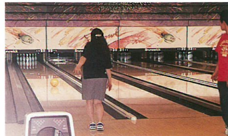
●5日 新入社員フォローアップ研修(第1回)