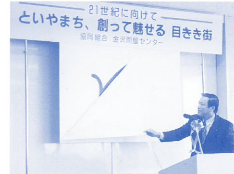
●16日 愛称と地域スローガン発表会開催 ●18日 シートベルト着用体験車の試乗キャンペーン実施