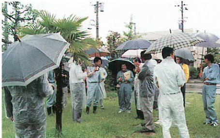
問屋町交通安全対策協議会 第31回 通常総会