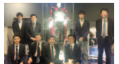
筑波のサイバーデザイン社視察。体の動きをアシストするパワードスーツの開発を行っている。