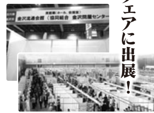
300を超える企業や団体が出展し賑わった。