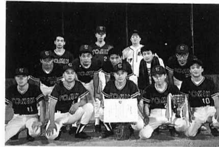
準優勝 富木医療器(株)