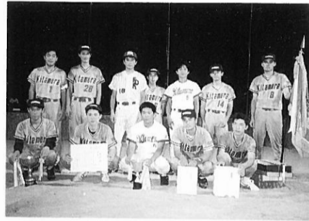
優勝 北村電機産業(株)