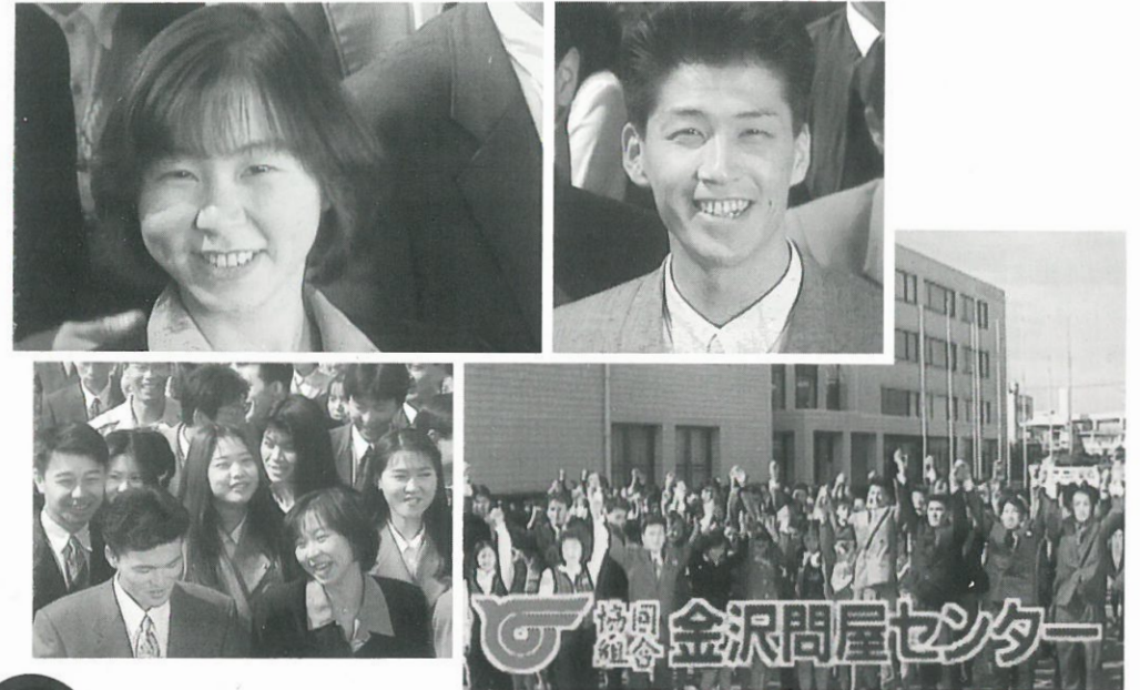
現在放送中のTVCMより