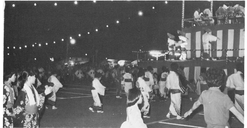
7月28日 第13回納涼盆踊り大会開催

その後一行は敦賀港より1万6千トンの日本一大きいフェリーに乗船して約4時間、日本海を回遊し、船の旅を楽しんだ。車中ではチビっ子のど自慢大会、クイズ大会が催され、子供達は楽しい雰囲気の中でお互いの友情を深め、午後7時無事帰着しました。